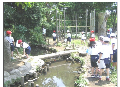
<フィールドでビンゴ>