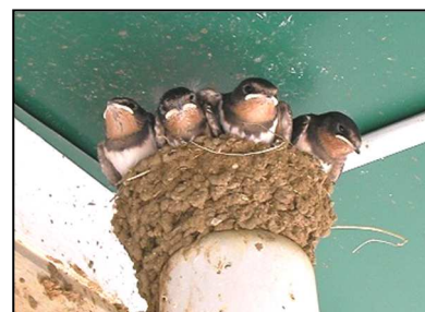
<ツバメの巣とヒナ>